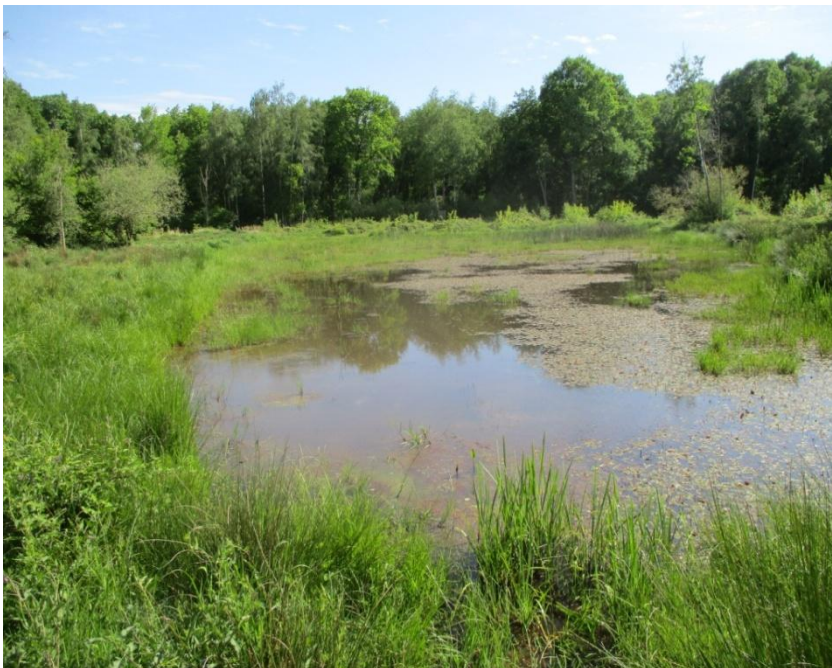
Photo de la gloie à vaches dans la forêt de Chamery